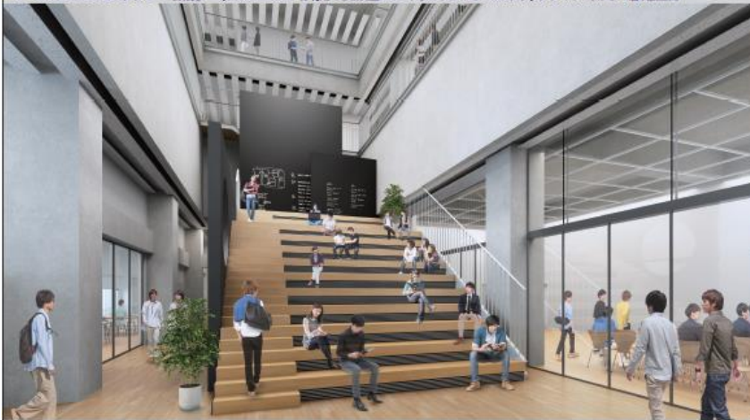
カフェラウンジ ～片平開広場とステップテラスをつなぐ～