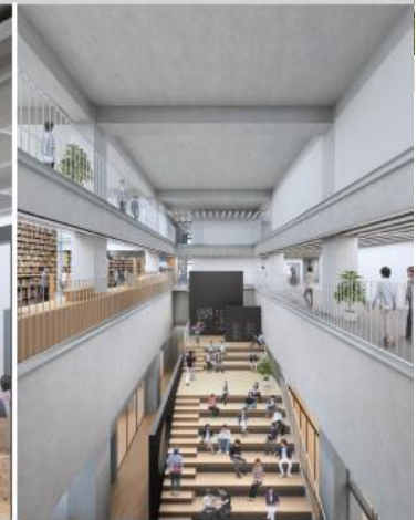
視察用ラボ ～広場に開かれ、施設の顔となるオープンラボ～