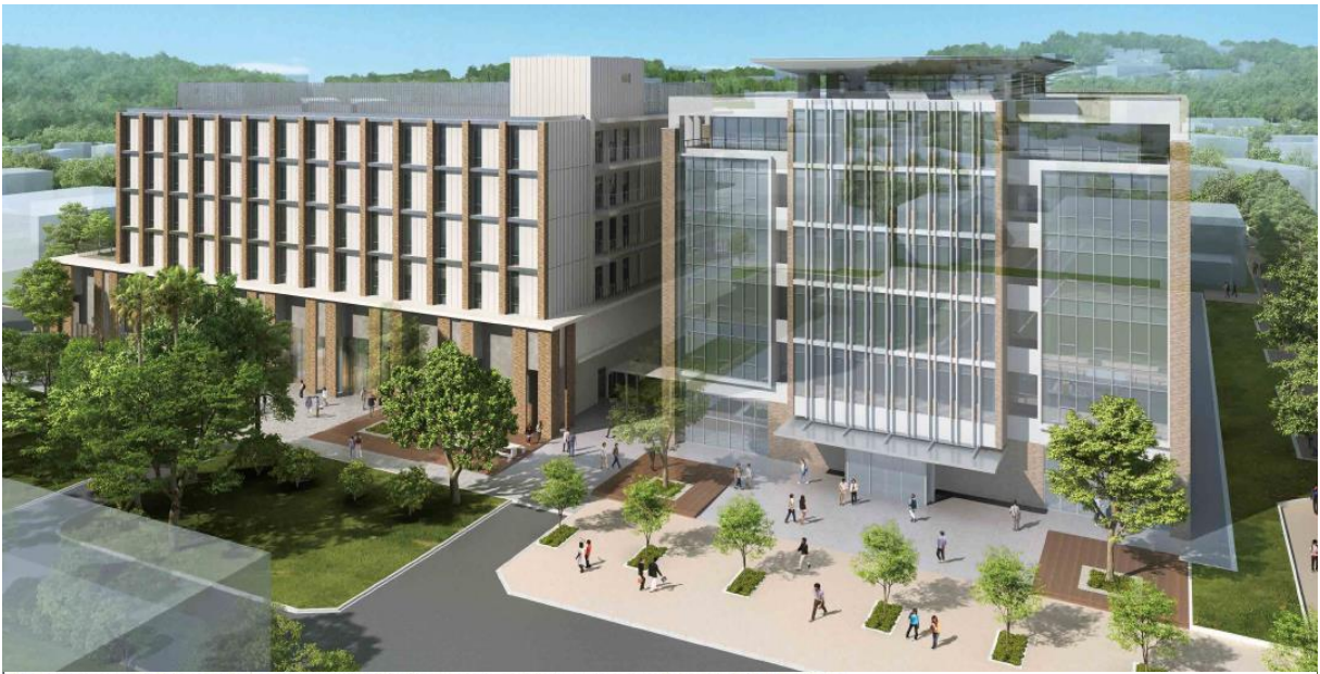
オープンインベシヨントラス ～視察用オープンスペースと一体利用でき研究室ロビー、ナレッジコモンとステップテラスでつながる3層吹き抜け～